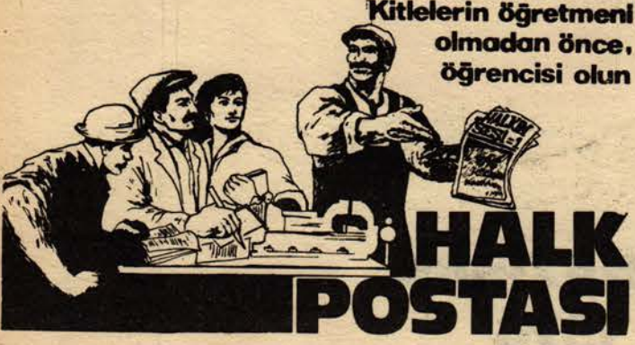
Kitlelerin öğretmeni olmadan önce, öğrencisi olun

GÖZEN BASİMEVİNDEN 20 İŞÇİ: ÜZERİMİZDEKİ BASKILARI YENMEYE SÖZ VERİYORUZ.